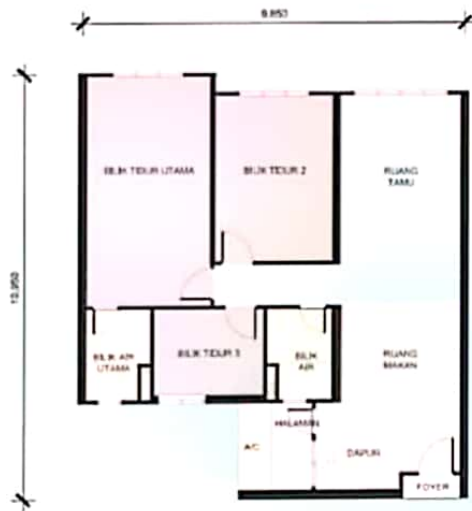
JENIS A 1,000 kaki persegi